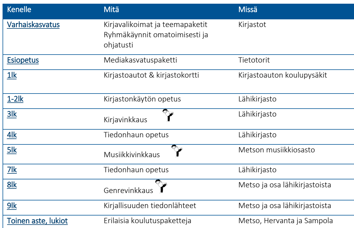
Taulukko 1. Yhteenveto kirjaston tarjoamista yhteistyömuodoista

Kirjastot tarjoavat monipuolisen oppimisympäristön, josta löytyy erilaisia e-aineistoja, tietokantoja ja fyysisiä aineistoja eri kielillä. Aineistot tukevat opetussuunnitelman monilukutaidon tavoitetta sekä muita laaja-alaisen osaamisen osa-alueita.