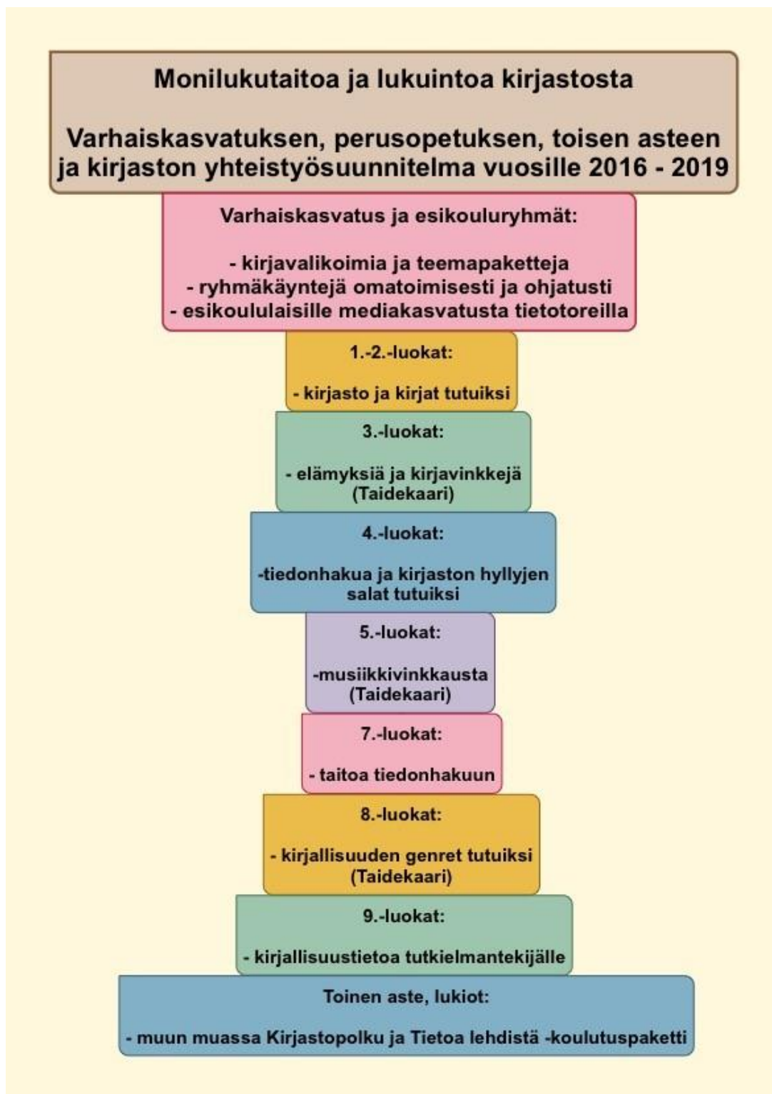
Kuvio 1. Varhaiskasvatukselle ja perusopetukselle kohdennetut kirjastopalvelut.