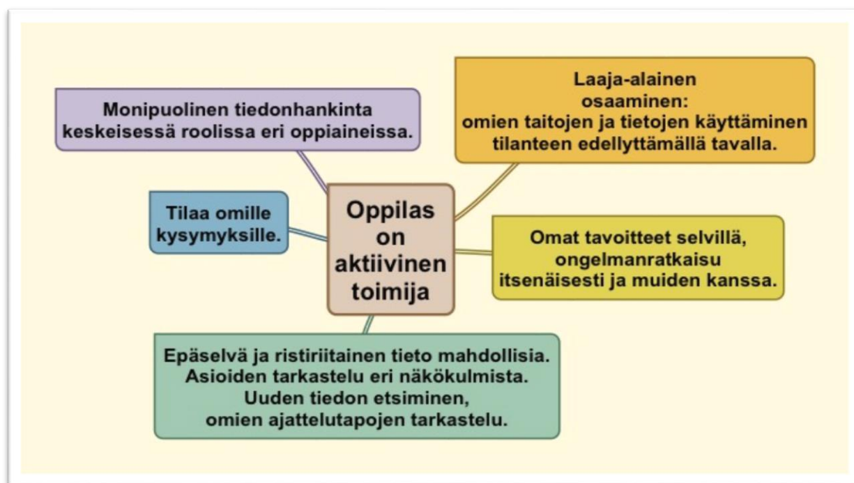
Kuvio 2. Opetussuunnitelman perusteiden oppimiskäsitys.

Opetussuunnitelman perusteet nojaavat oppimiskäsitykseen, jonka mukaan oppilas on aktiivinen toimija. Hän oppii asettamaan tavoitteita ja ratkaisemaan ongelmia sekä itsenäisesti että yhdessä muiden kanssa. Tavoitteena on oppilaiden laaja-alainen osaaminen: oppilaat omaksuvat tavan käyttää tietojaan ja taitojaan tilanteen edellyttämällä tavalla. Lisäksi oppilaita rohkaistaan epäselvän ja ristiriitaisen tiedon äärellä olemiseen, ja heitä ohjataan pohtimaan asioita useista eri näkökulmista, hakemaan uutta tietoa ja tarkastelemaan omia ajattelutapojaan.