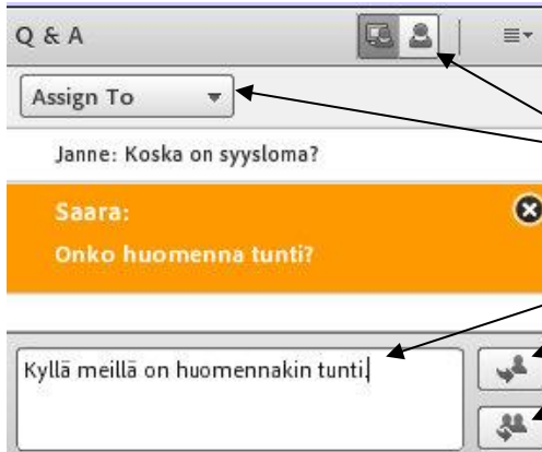
Hostin ja presenterin näkymä

Q&A-työkalua (Question & Answer) voi käyttää osallistujien esittämiin kysymyksiin vastaamiseen. Tämä voi olla hyödyllistä etenkin kokouksissa tai webinaareissa, mutta miksei myös oppitunneilla, jos tuntuu että kirjoitetut kysymykset tahtovat kadota chatiin.